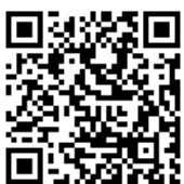
公式 LINE QRコード