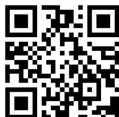
公式インスタグラム QRコード