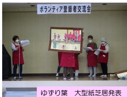
ゆずり葉 大型紙芝居発表

ゆずり葉の大型紙芝居の活動発表で場が和んだ後、自己紹介を行い「コロナ禍におけるボランティア活動について」話し合いをしました。具体的には“コロナ禍で困った事”“工夫した事”“これからしたい事”等で立場や活動内容が異なるため様々な意見がでました。