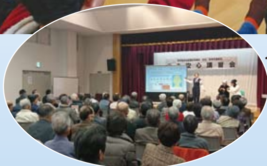
安全安心講習会（地区社協）