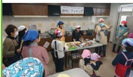
おやこクッキング