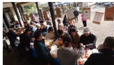
ふれあい野菜即売会

また、4月1日から高齢者のみなさんが、いつまでも住み慣れた地域で安心して暮らしていけるように、介護・福祉・健康・医療など、さまざまな面から支えるため市の機関で第4地域包括支援センターも平和地区公民館で開設しております。