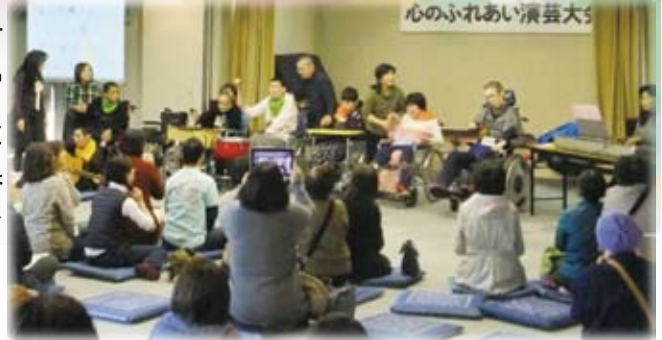
音楽療法で演芸大会に出演

「自分でできることは自分で!楽しく!生き生きと生活ができるように」をモットーに運動訓練や音楽療法、調理実習、制作活動(絵画、工作など)、劇発表会、屋外での活動など、様々な支援を行っています。