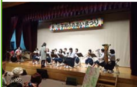
平和ふれあいまつり

9月には住民の親睦と交流を通じて地域の連帯意識を深めるとともに、青少年の健全育成を目的とした「平和ふれあいまつり」を開催しています。そして地区内で収穫した農産物の即売を通じて生産者が多い地域住民と消費者が多い地域住民等の一体感を感じる交流事業「ふれあい野菜即売会」も実施しています。