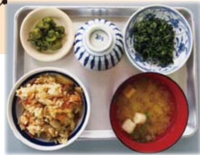
かやくご飯、味噌汁、おかず(一品) ご飯はおかわり自由です。