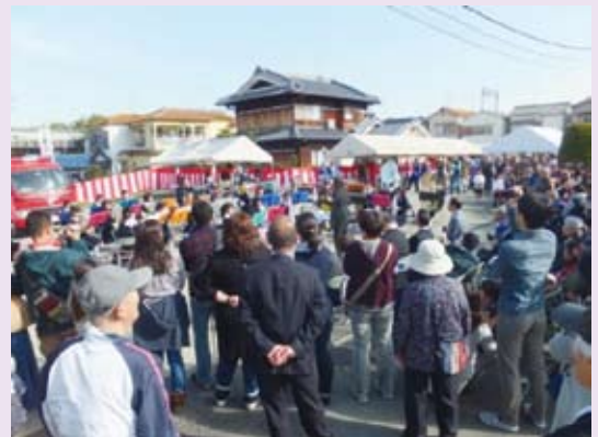
昭和地区ふれあいまつり

特に、昭和地区ふれあいまつりは、地域住民・学校関係・病院・福祉施設・工業団地を含む事業所などが協力し、地域が笑顔で「つながる」一大イベントで、つながりをさらに深め、新たなつながりを生み広げる原動力となっています。