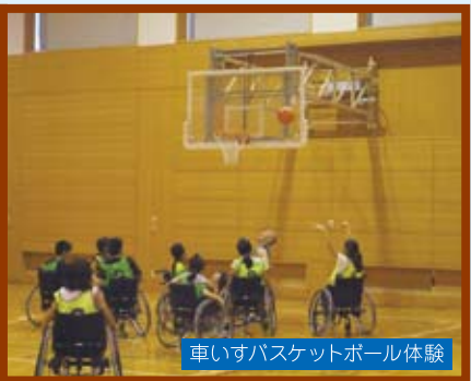
車いすバスケットボール体験