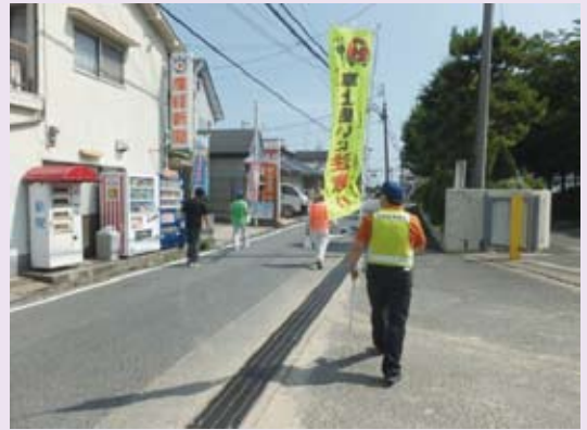
地域安全パトロール

昭和地区は市南部に位置し、西に昭和工業団地、南に聖徳太子建立と伝えられる額安寺 かくあんじ や、重要文化財 かくあんじ ごりんとう の額安寺五輪塔群など、新旧が入り交じった地域です。