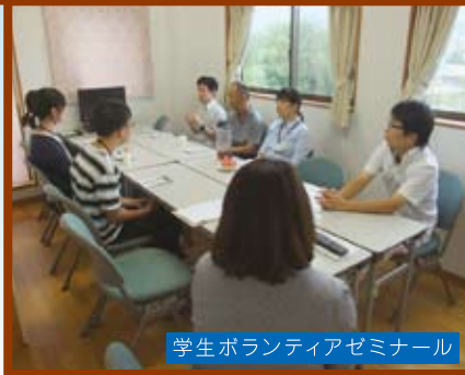
学生ボランティアセミナー