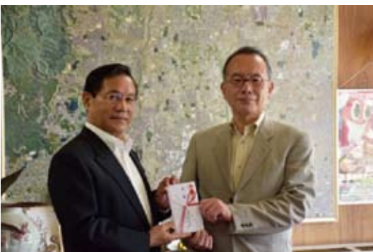
奈良県自動車販売店協会様