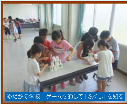
めだかの学校 ゲームを通して「ふくし」を知る