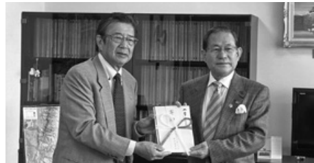
矢田ふる里まつり実行委員会 様