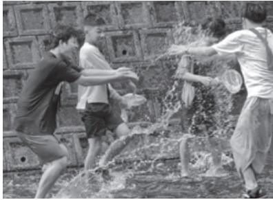
母子父子家庭の集い (ワンパク広場)