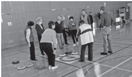
カローリング大会