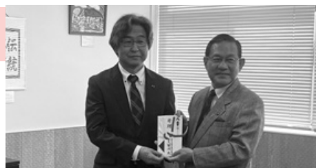
奈良県自動車販売店協会 様