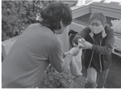
ひとり暮らし老人等 見守り事業