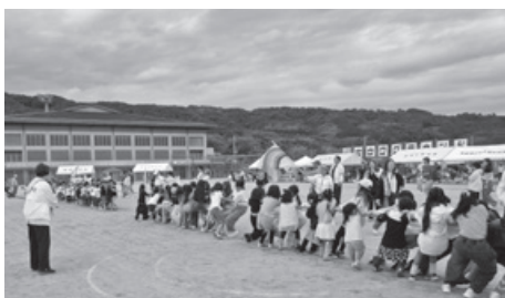
第41回矢田ふる里まつり