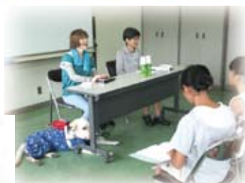
▲盲導犬とのふれあい