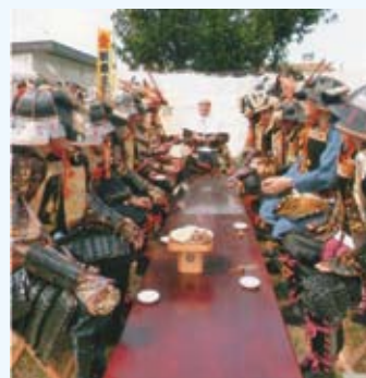
順慶まつり出陣式

地域には新規戸建てや移住による若年層の人口増もありますが、それ以上に高齢化が進む地区のため、ひとり暮らし高齢者見守り事業に合わせて、ボランティアが作成した「カレンダー配布」を行い、住民同士の支え合いの仕組みとして「そっと見守り」事業を各自治会に定着させていきつつ、災害発生時にも機能するように努めていきます。