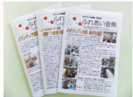
ボランティア情報誌「ふれあい金魚」

ボランティアビューローは ボランティアに関する相談 窓口です。 気軽にご相談下さい。