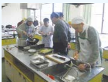
男性の料理講習会