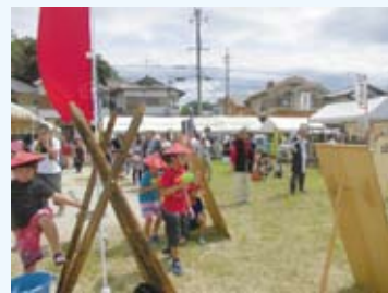
順慶まつり水攻め合戦