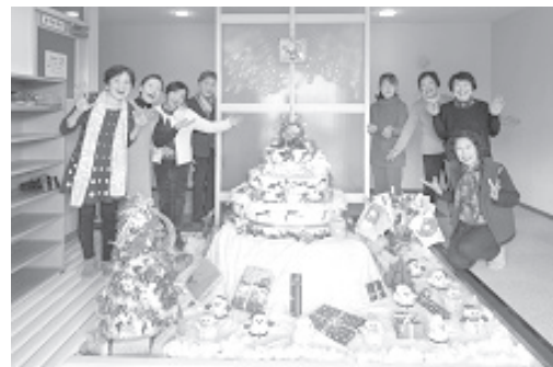
クリスマスケーキ