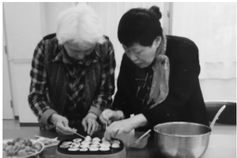
たこ焼パーティー

年間の活動は、簡単な体操から始まり、健口体操、音楽療法、折り紙、小物作り、お花見。中でも一番楽しみにしていただいているのは、クリスマス会での食事、歌、ゲームなどの催しです。