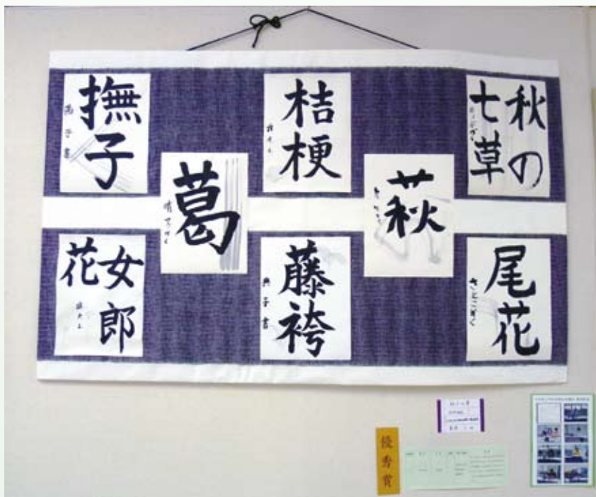
奈良県障害者作品展「優秀賞」受賞